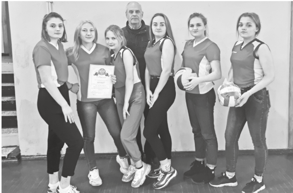
Сборная Байкаловской СОШ.

В младшую группу юношей заявились всего две команды – Байкалово и Нижняя Иленка. Первую партию байкаловцы начали активно и повели в счёт. Гости поначалу тушевались и действовали скованно. Однако, освоившись на чужой площадке, перехватили инициативу и вырвали победу в первом сете – 27:25. Вторую партию нижеиленцы