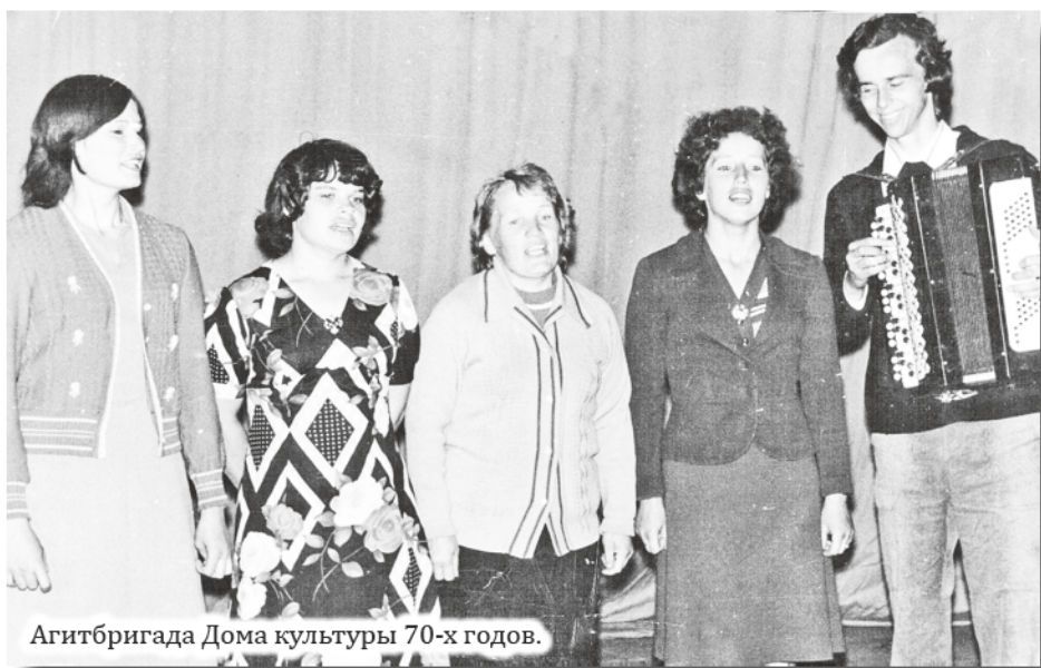
Агитбригада Дома культуры 70-х годов.